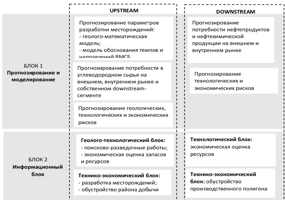
Рисунок 2 – Элементы системы модельных конструкций и расчетных процедур деятельности ВИНК

Блок 1 модельной конструкцией ВИНК, характеризующей особенности освоения нефтегазовых ресурсов, а также рыночные и потребительские тренды нефтегазового комплекса. Блок 2 модулей направлен на подготовку информации (геолого-, технолого- и технико-экономической) для расчетов эффективности программы. Моделирование процессов downstream-сегмента производится в соответствии с принципом максимизации цепочки создания стоимости ВИНК. После формирования стратегических вводных необходимо перейти к проработке направлений развития стратегических преимуществ компании согласно уточненной в работе классификации.