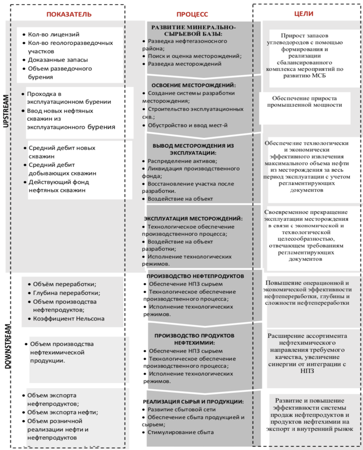
Рисунок 5 – Логическая схема взаимосвязи ключевые показатели процесс-результаты бизнес-сегментов с целями ВИНК на основе процессно-целевого подхода

Эталонная динамика ключевых показателей ВИНК построена согласно правилу: