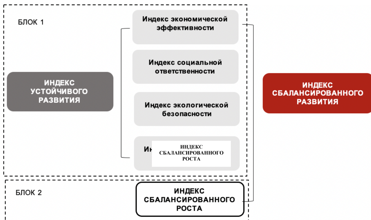
Рисунок 4 – Структура семейства индексов сбалансированного развития ВИНК

экономических систем для разведки и разработки крупных нефтегазовых месторождений и производства нефтепродуктов.