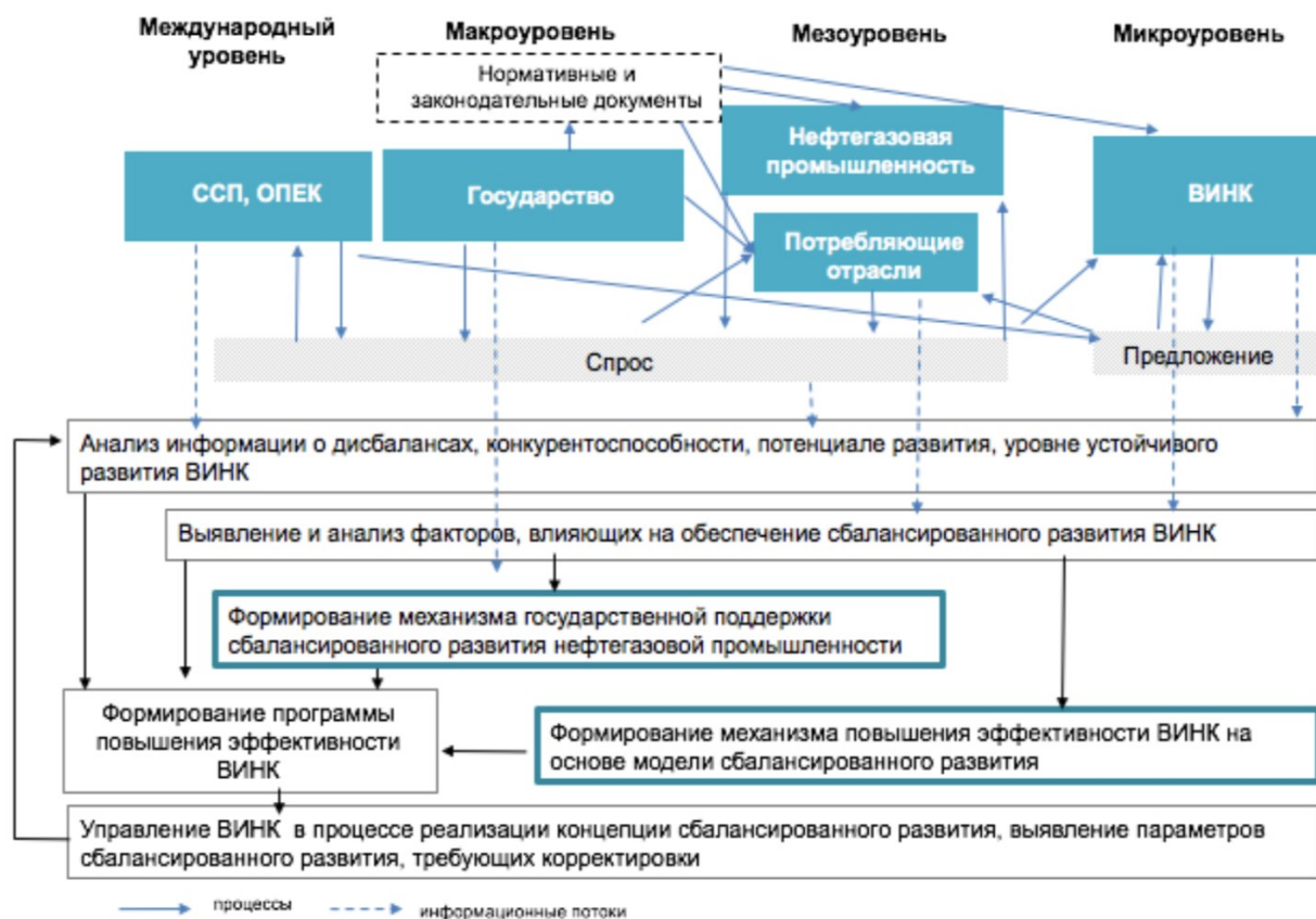
Рисунок 3 – Концептуальная схема управления сбалансированным развитием нефтегазовой промышленности

В работе показана ограниченность существующих подходов к государственному регулированию; в рамках доминирующей методологии процесс вмешательства государства интерпретируется как внешний по отношению к экономике. Предложенный автором подход позволяет пересмотреть проблемное поле, исходя из видения государства как особого субъекта, регулирующего системные изменения в нефтегазовой промышленности на основе формирования баланса экономических интересов и кооперационно-конкурентных связей. Он предполагает формирование механизмов государственного регулирования стратегических преимуществ ВИНК с учетом изменений, происходящих на всех уровнях экономики (рис. 3).